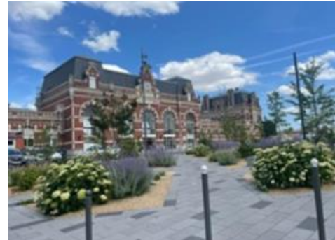
Aménagement de la Place Maurice Schumann