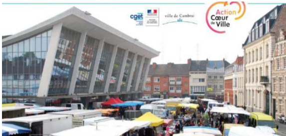
Travaux du Marché Couvert