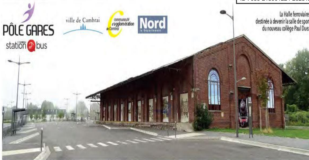
Transformation de la halle Sernam en salle de sports