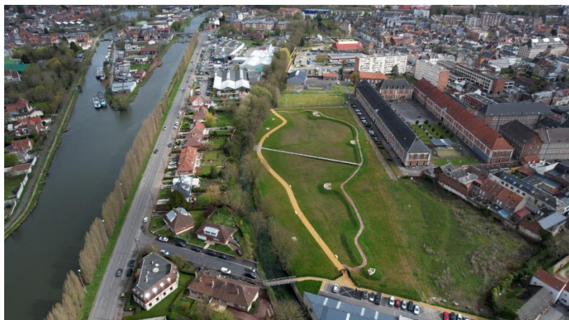
La promenade des amoureux