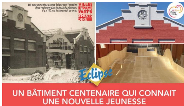
Aménagement du centre Eclipse