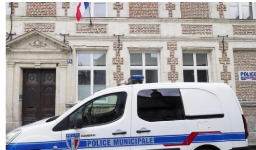
Création d'une police municipale avec son installation dans une ancienne école